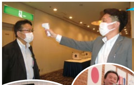
会場に入る前に 体温チェックと 消毒はしっかりと。