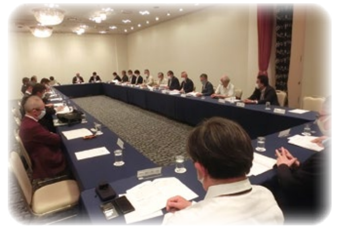
《クラブ協議会風景》

最後になりますが、今年1年、ひとつ生意気なじいひでございますが、よろしくお願ひしたいと思います。どうも今日はありがとうございます。