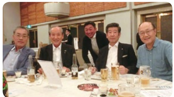
アイデアを出し合って 皆で頑張りましょう!